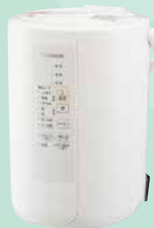
スチーム式加湿器 ポットみたいに、お手入れ簡単！ 清潔な蒸気のスチーム式 沸騰させたきれいな蒸気を、 約65℃まで冷ましてお部屋を加湿します。