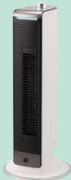
送風機能付きファンヒーター これ一台で冬は温風機、 夏は送風機として