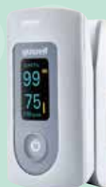
パルスオキシメーター 指を挟むだけで 酸素飽和度(SpO2)を簡単測定。 視認性のよいカラー液晶を採用。