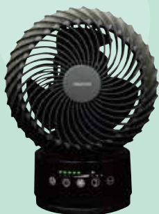
サーキュレーター 上下左右自動首振り機能で 広い範囲に風をお届けします。