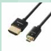
HDMI マイクロコネクタ